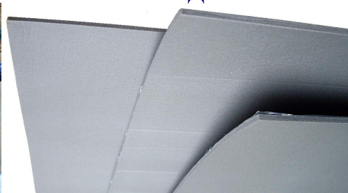
Isolontape 500 маты