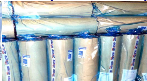
Isolontape 500 рулоны